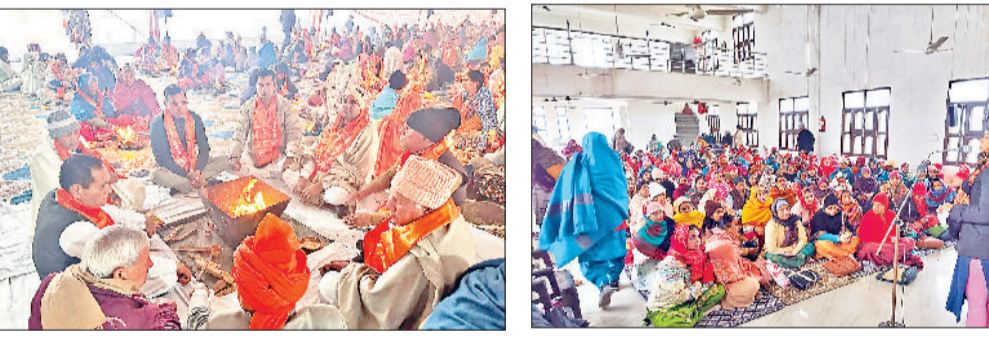
हरिभूमि न्यूज रोहतक