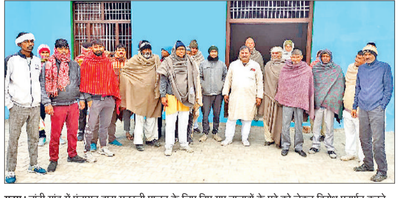
महम। चांदी गांव में पंचायत द्वारा मछली पालन के लिए दिए गए तालाबों के पट्टे को लेकर विरोध प्रदर्शन करते ग्रामीण।

जानकारी के अभाव में गांव का कोई भी व्यक्ति इन तालाबों की बोली नहीं लगा सका