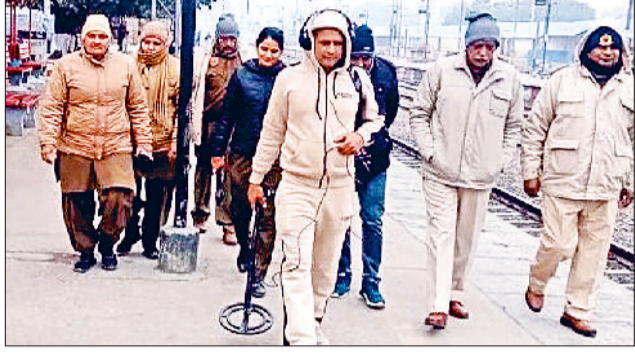
रोहतक। रेलवे स्टेशन पर जांच करती बम निरोधक दस्ते की टीम।

पुलिस ने चलाया चेकिंग अभियान बम निरोधक दस्ता भी पहुंचा